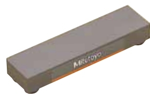
601645 100 (W) × 25 (D) × 12 (H) mm