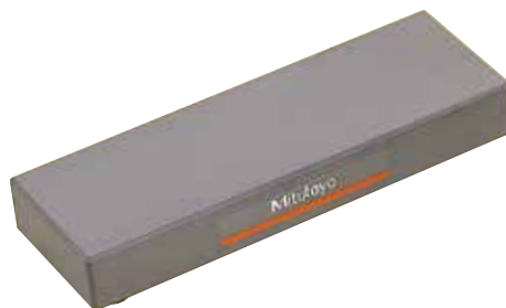
601644 150 (W) × 50 (D) × 20 (H) mm